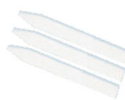
パリアスリーブ (50枚)