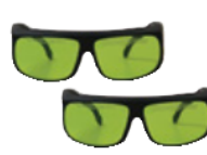
レーザゴーグル (2個)