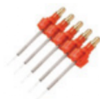
ファイバチップ(400μm) (5本)