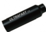
バッテリーアセンブリ (1個)